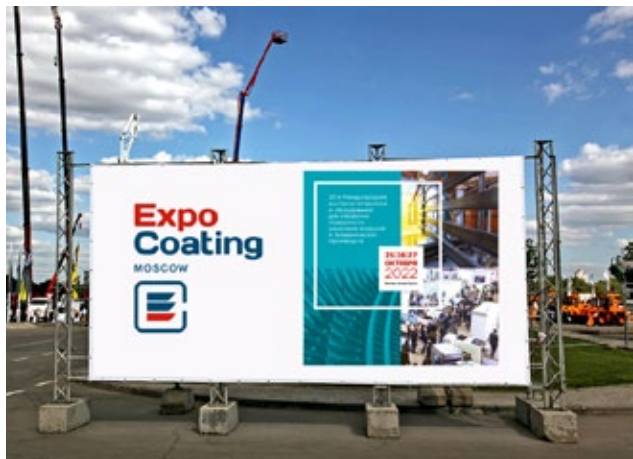
Рекламные конструкции различных размеров