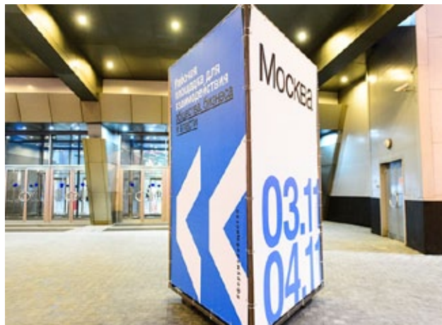
Рекламная конструкция «треугольник» со стороной 2х3 м