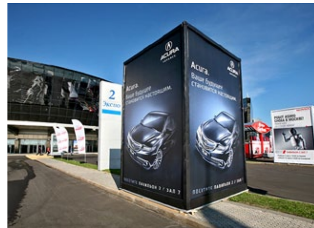
Рекламная конструкция «прямоугольник» со стороной 2х3 м