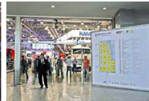
Конструкция 4x2,8 м