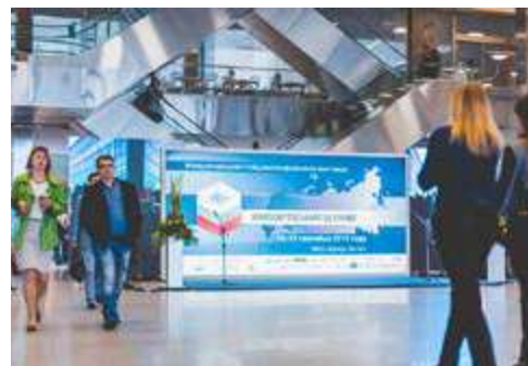
Рекламные конструкции разных размеров (одна сторона) Конструкция 6x2,8 м