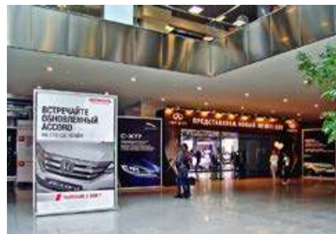
Конструкция 2x2,9 м