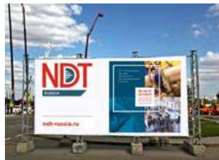
Рекламная конструкция «прямоугольник» со стороной 2х3 м